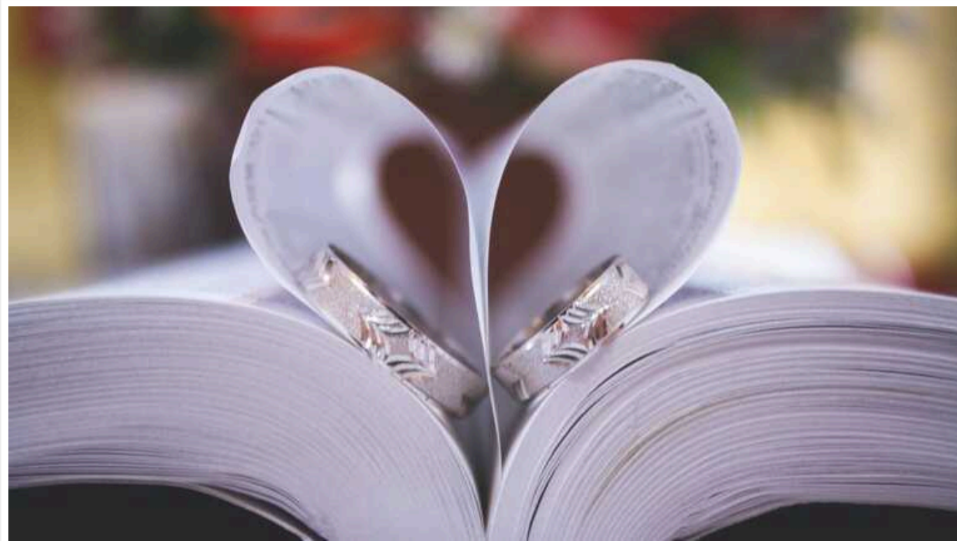
Стало відомо, скільки нових сімей з'явилося у Києві та області у День закоханих

У Києві в середу, 14 лютого, у День закоханих з'явилося 140 нових сімей. Крім того, у на Київщині об'єдналось 80 пар молодят.