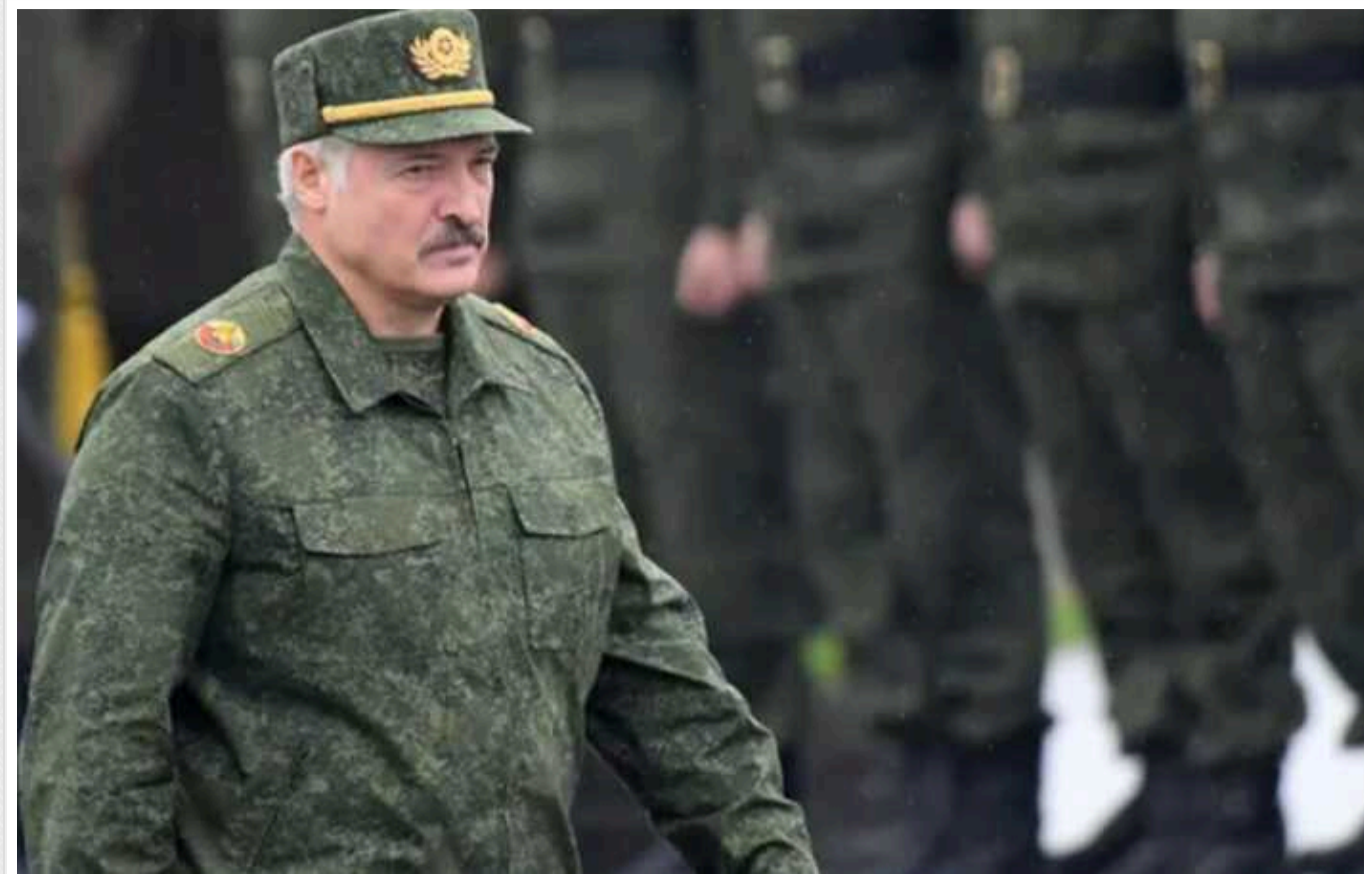
Білорусь ввела режим контртерористичної операції у районі, що межує з Україною

У Білорусі оголосили режим контртерористичної операції у Лельчицькому районі Гомельської області, що межує з Україною. Місцевих жителів закликали не лякати сирен, зберігати спокій та підкорятися вимогам силовиків.