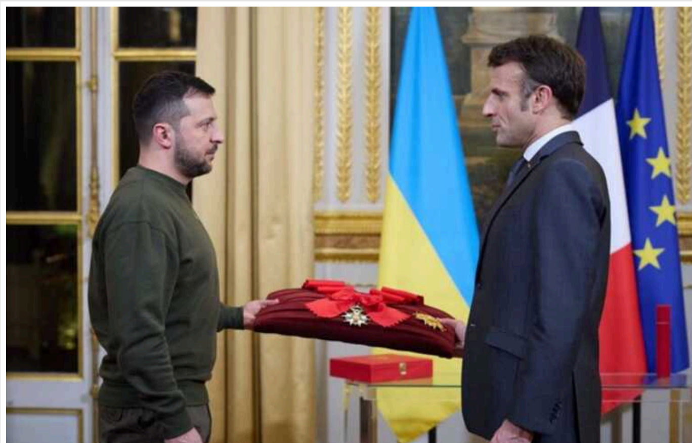
Макрон та Зеленський завтра підпишуть угоду про безпеку

Президент Франції Еммануель Макрон і президент України Володимир Зеленський підпишуть угоду про безпеку між двома країнами. Підписання документа відбудеться у п'ятницю, 16 лютого, в Єлисейському палаці.