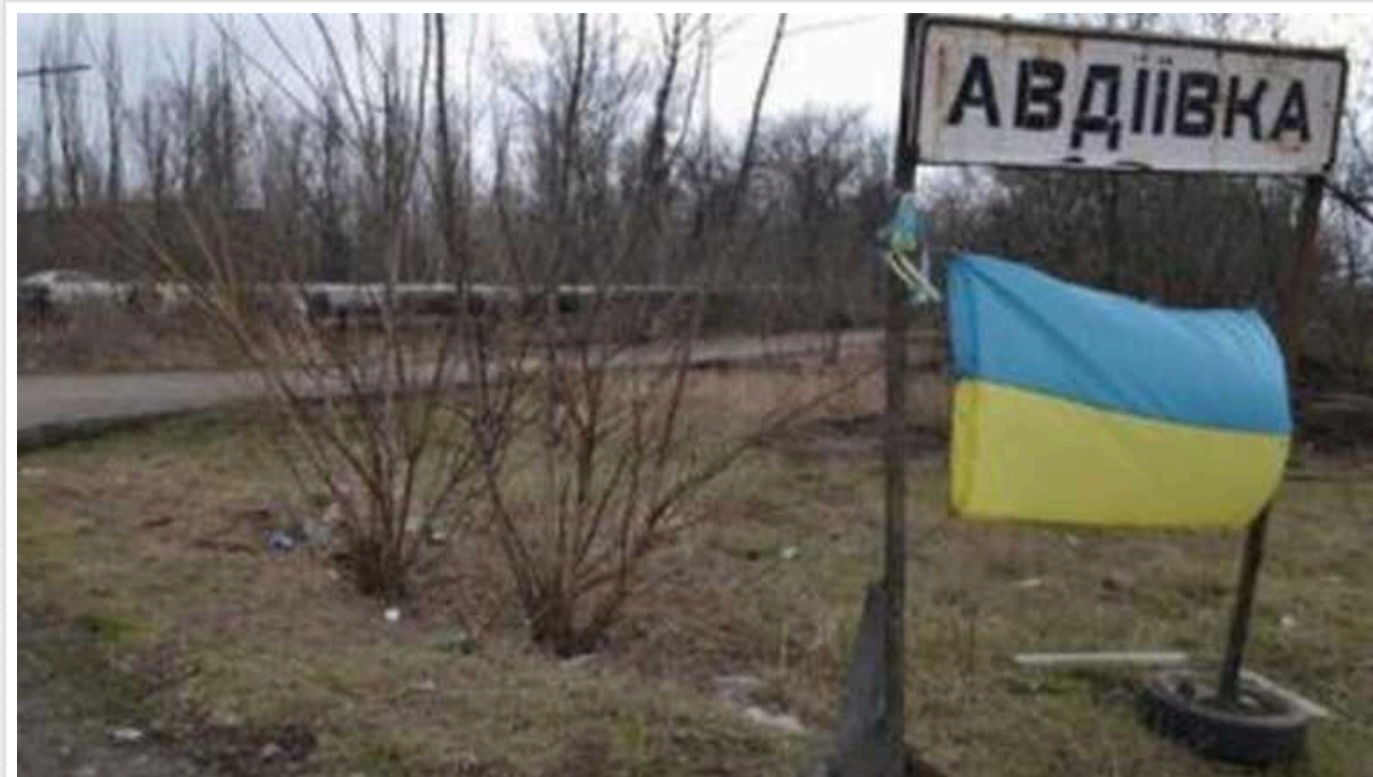
Financial Times: захист Авдіївки – важке рішення для України

Рішення зав'язати захищати Авдіївку в умовах дефіциту людей та боєприпасів може виявитися для України таким же дорогим, як і втрата у Бахмуті досвідчених бійців, що підірвало літній контрнаступ.