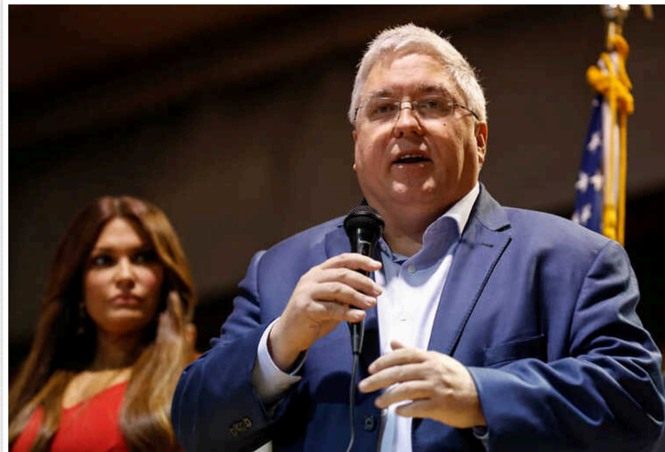
Генпрокурор Західної Вірджинії закликав Камалу Гарріс визнати Байдена недієздатним

Генпрокурор Західної Вірджинії закликав віце-президента Камалу Гарріс визнати Джо Байдена недієздатним та взяти на себе обов'язки президента США.