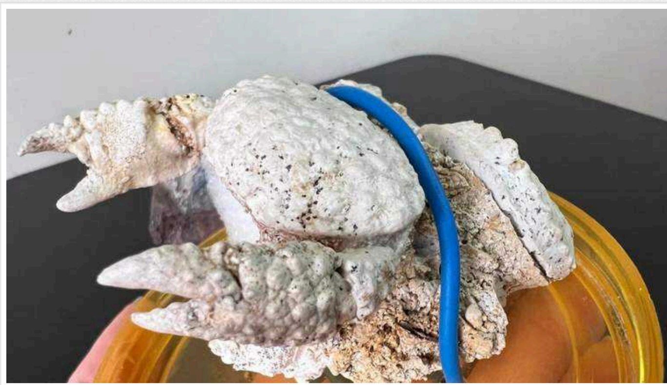
Київські митники виявили у посилці скам'янілості віком 400 мільйонів років

Київські митники виявили в посилці, яку відправляли з Тернополя, рештки давніх істот, яким 400 мільйонів років. Відправлення прямувало до Тайваню. Серед стародавніх скам'янілостей – цементований краб, віком 20 млн років, панцирі риб та молюски. За висновками експертів, рештки скоріш за все знайшли в басейні річки Дністер. Скам'янілості конфіскували, а пізніше передадуть до музею.