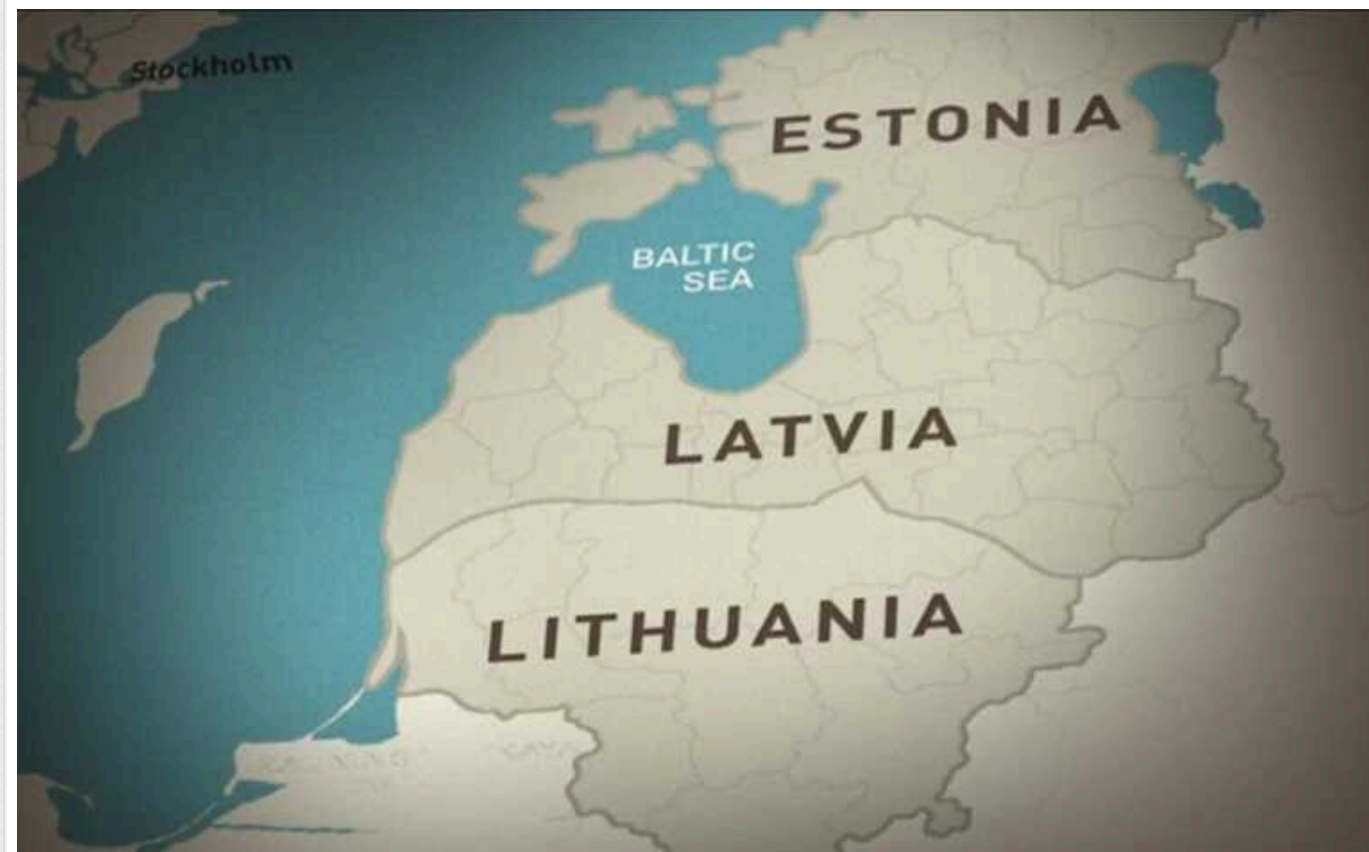
Литва, Латвія та Естонія готуються до вторгнення РФ: триває будівництво численних укріплень, – The Times

"Зуби дракона", мінні поля, протитанкові рови та лінії з колючого дроту на дадачу до укріплених бункерів будуть розділяти країни Балтії та РФ і Білорусь.