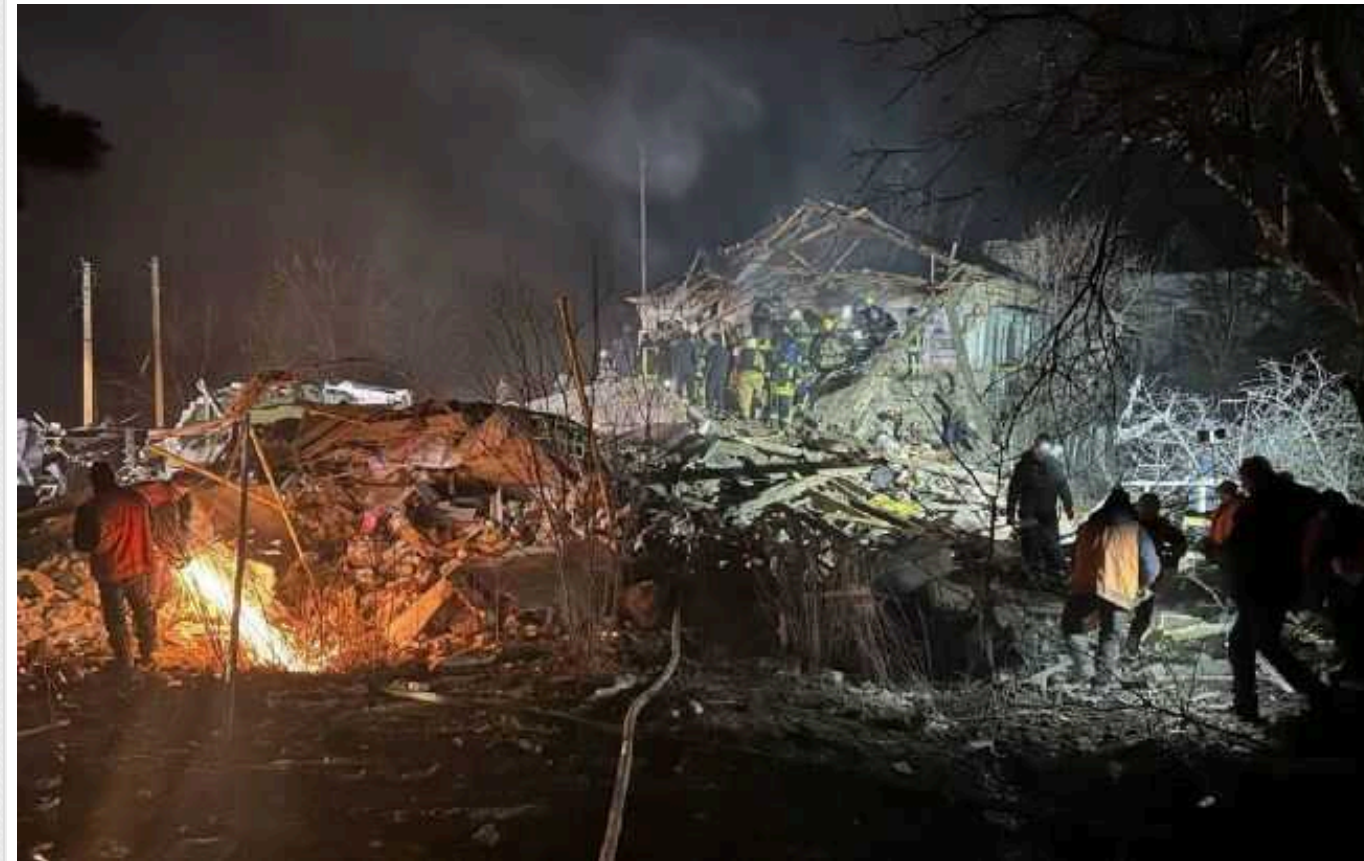
Атака по Харківській області 14 лютого: кількість жертв збільшилася

Кількість жертв внаслідок ракетного удару по Великому Бурлуку Харківської області збільшилася. З-під завалів дістали тіло жінки.