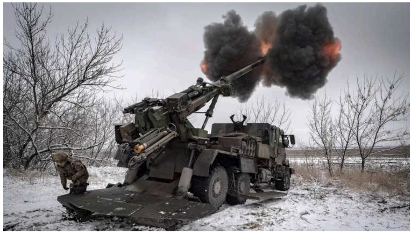
Ситуація на фронті: Ворог завдав 4 ракетних та 106 авіаційних ударів

Противник і надалі продовжує ігнорувати закони та звичаї ведення війни, використовує тактику терору, завдає ракетних та авіаційних ударів, здійснює обстріли з реактивних систем залпового вогню не тільки по військових, а й по численних цивільних об'єктах нашої держави.