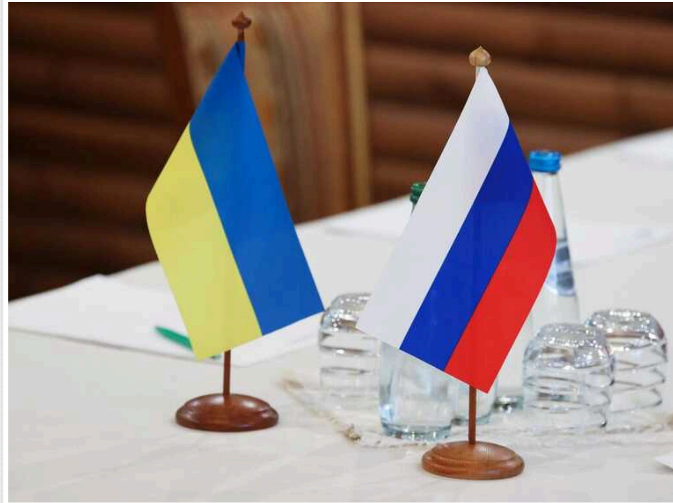
Радники Трампа обговорили можливості посадити Зеленського та Путіна за стіл переговорів, – Bloomberg

Радники експрезидента США Дональда Трампа обговорювали можливість на початку можливого другого терміну президентства посадити Президента України Володимира Зеленського та президента Росії Володимира Путіна за стіл переговорів.