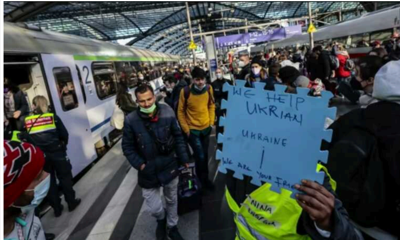
У Німеччині сотні румунів отримали гроші й житло під виглядом біженців з України

У Німеччині викрили сотні громадян Румунії, які під виглядом біженців із України отримали гроші та житло.