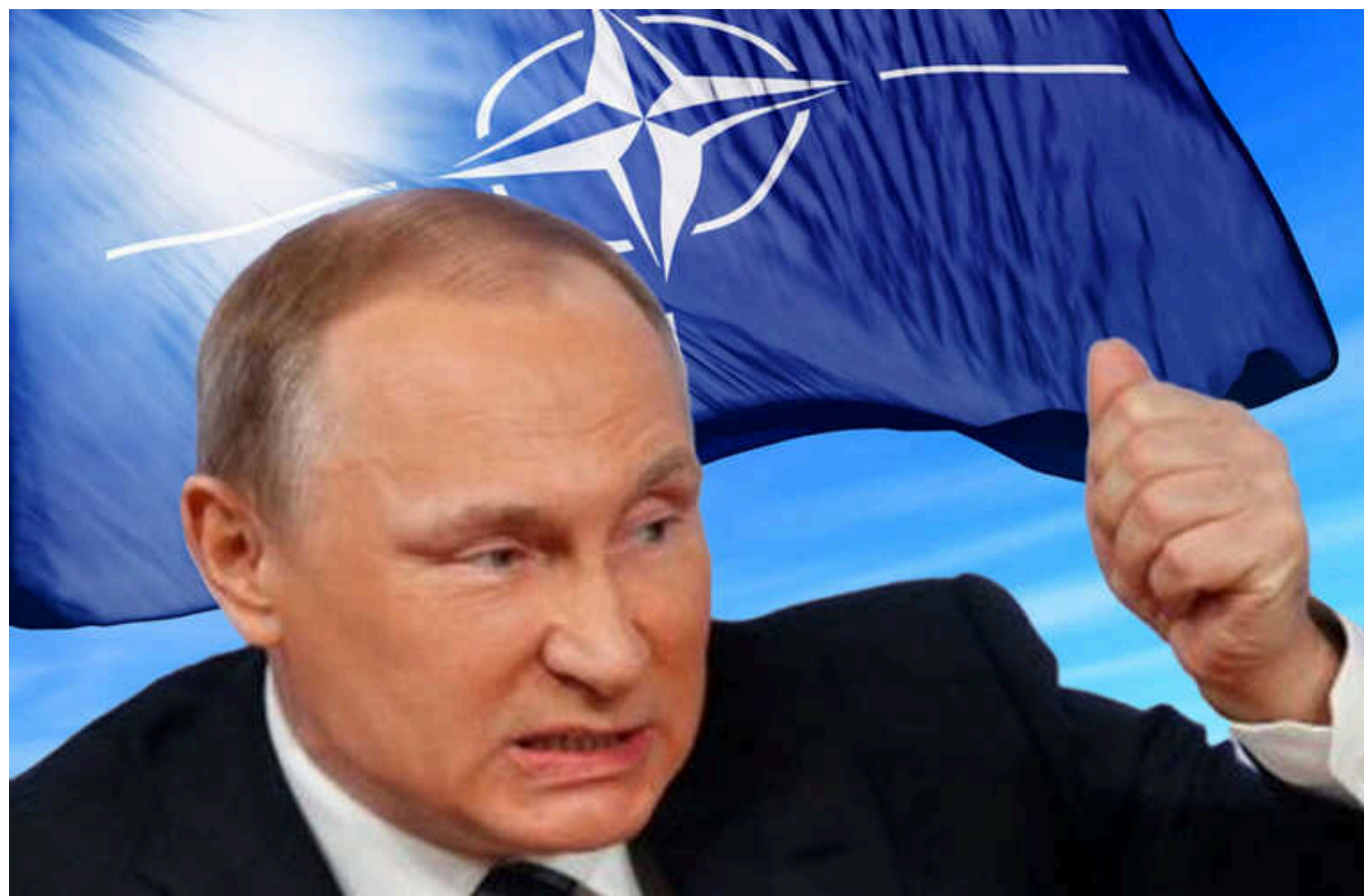
У Литві закликали країни НАТО не ігнорувати загрозу від Росії

Росія вважає сусідні з нею держави частиною своєї "імперії", тож ці країни завжди будуть під загрозою російського вторгнення. Повномасштабна війна Росії проти України може бути частиною більш масштабного плану Москви.