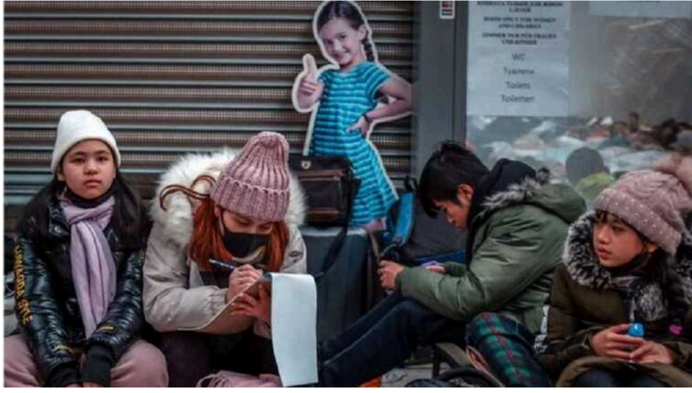
У Німеччині сотні румунів видавали себе за біженців із України

У Німеччині було спіймано на брехні сотні громадян Румунії, які видавали себе за українських біженців. Вони робили це для того, щоб отримувати допомогу.