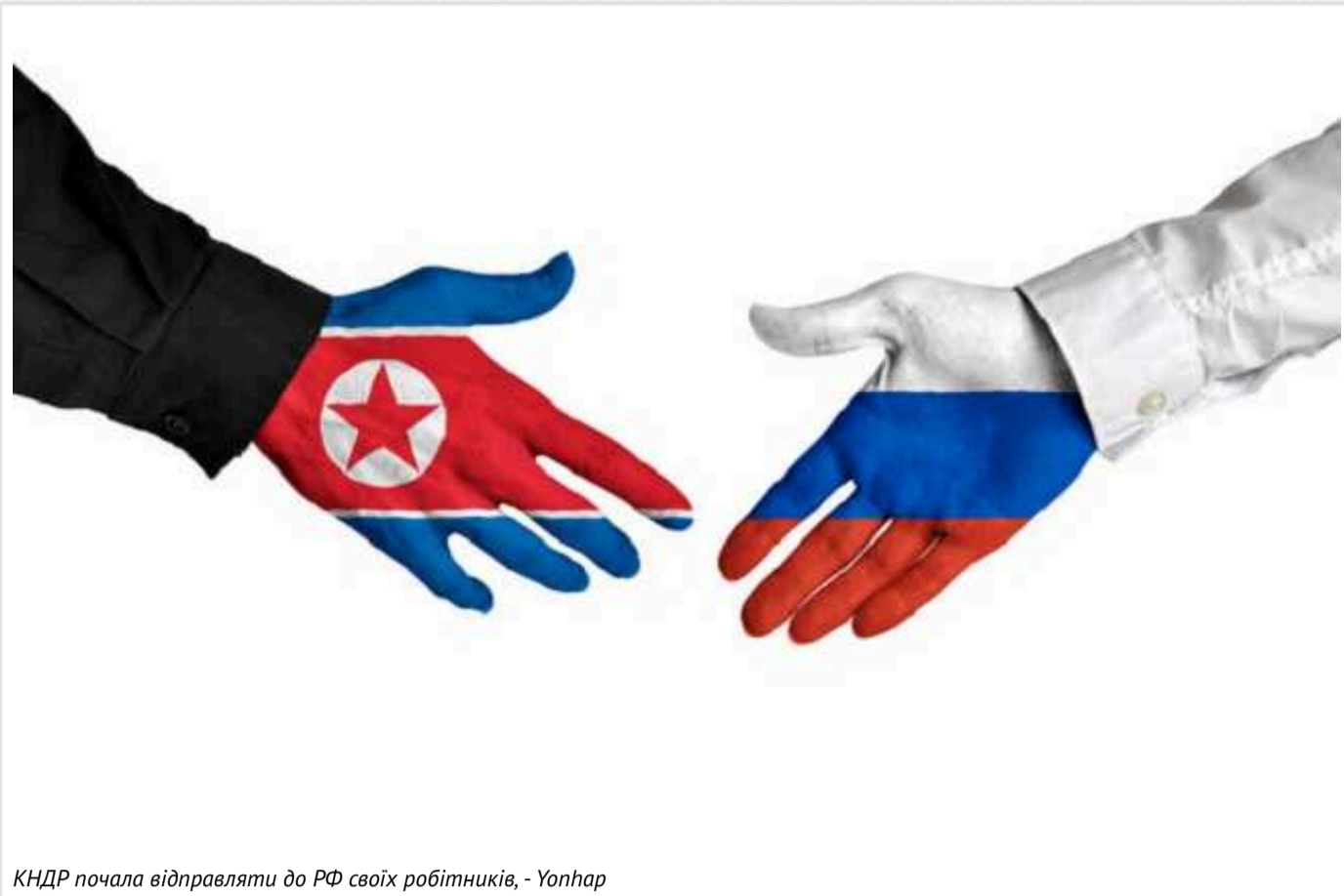
КНДР почала відправляти до РФ своїх робітників, - Yonhap

На початку цього місяця близько 300 осіб, ймовірно північнокорейських робітників, прибули до Росії поїздом.