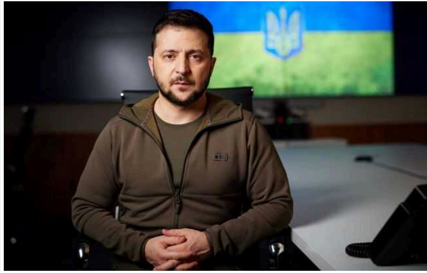
Сьогодні додалося безпеки в Чорному морі, ми очистимо його від російських терористичних об'єктів, - Зеленський

Президент України Володимир Зеленський подякував бійцям групи 13 9-го департаменту Головного управління розвідки та війнам Збройних сил за знищення російського великого десантного корабля "Цезар Куніков". Він зазначив, що завдяки їхнім діям сьогодні Чорне море стало більш безпечним.