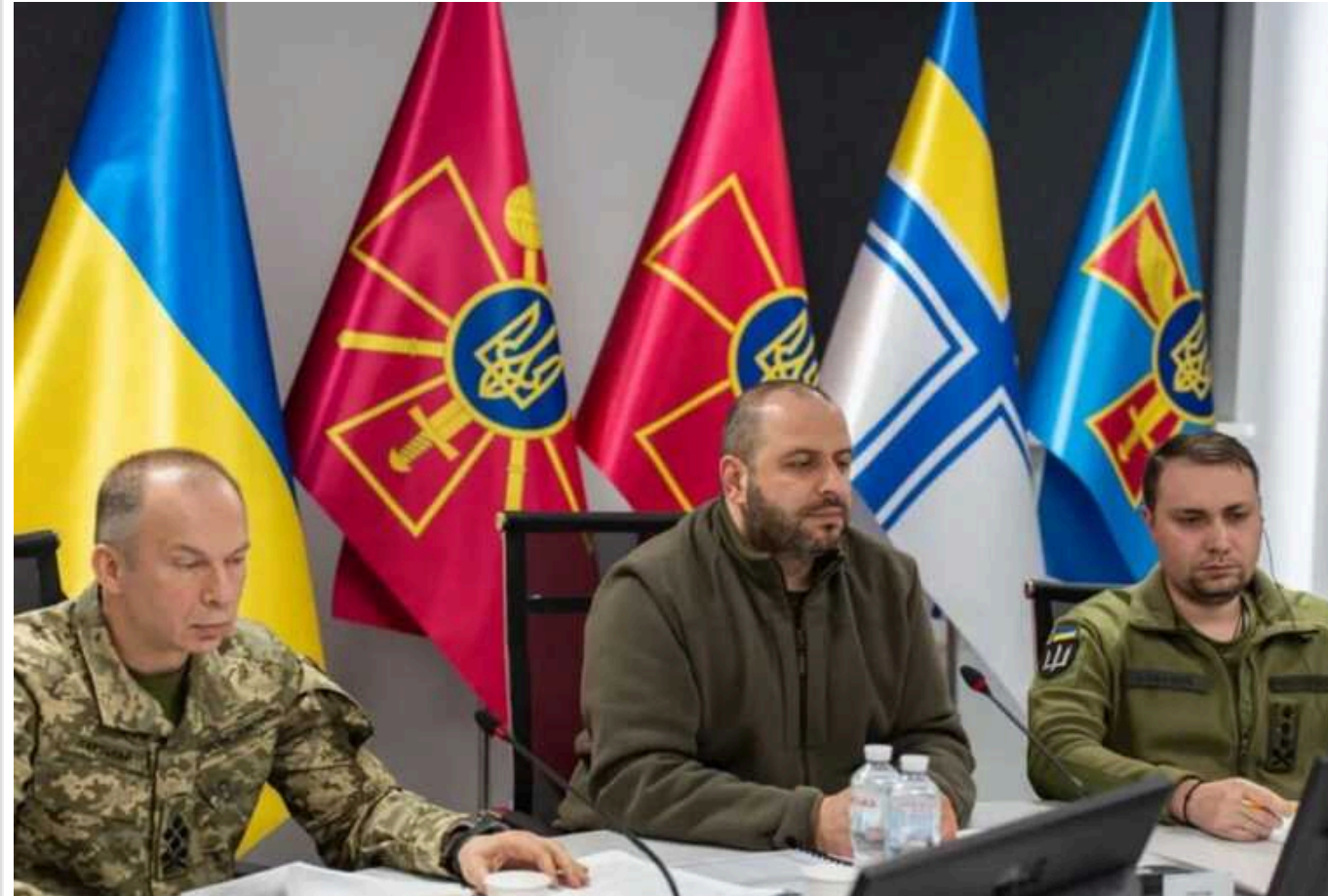
Деталі 19-ї зустрічі у форматі "Рамштайн": представили Сирського й обіцяють гарні новини

У Брюсселі, Бельгії, у штаб-квартирі НАТО розпочалося 19-те засідання контактної групи з питань оборони України у форматі "Рамштайн" за участю нового головнокомандувача ЗСУ Олександра Сирського. На засіданні підписали Меморандум щодо протиповітряної оборони для України, а також обговорили збільшення постачань артилерії, боеприпасів і ракет для української ППО.