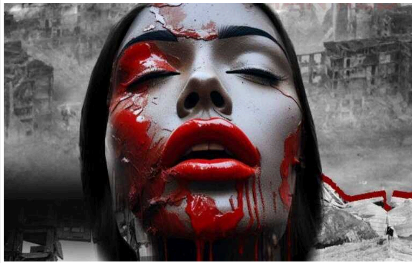
МЗС України звернулося до світу через губну помаду Russian Red від MAC Cosmetics: "Це не тон, а кров українців"

Міністерство закордонних справ України гостро відреагувало на скандал щодо всевітньо відомої канадської компанії MAC Cosmetics через назву одного із тонів помади, що прямо натякає на тероризм росіян. Russian Red – саме таку ганебну назву отримав той самий ідеальний колір помади, який обожнюють у світі та який неймовірно сильно асоціюється із кров'ю українців.