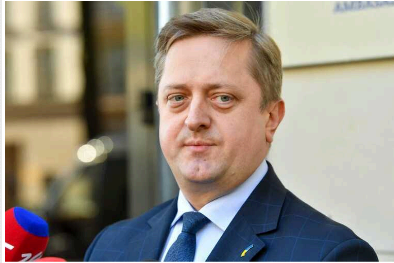
Посол України попередив про наслідки повної блокади на кордоні Польщі та України

Польські фермери, які блокують кордон, не мають об'єктивних причин для розширення протесту. Вимоги страйкарів уже почули в Європейському Союзі, а тому подальше вирішення проблем має перейти у конструктивне та переговорне русло. Інакше виграватиме лише Росія, і фермери, які мітингують, теж виявляться серед тих, хто програє.