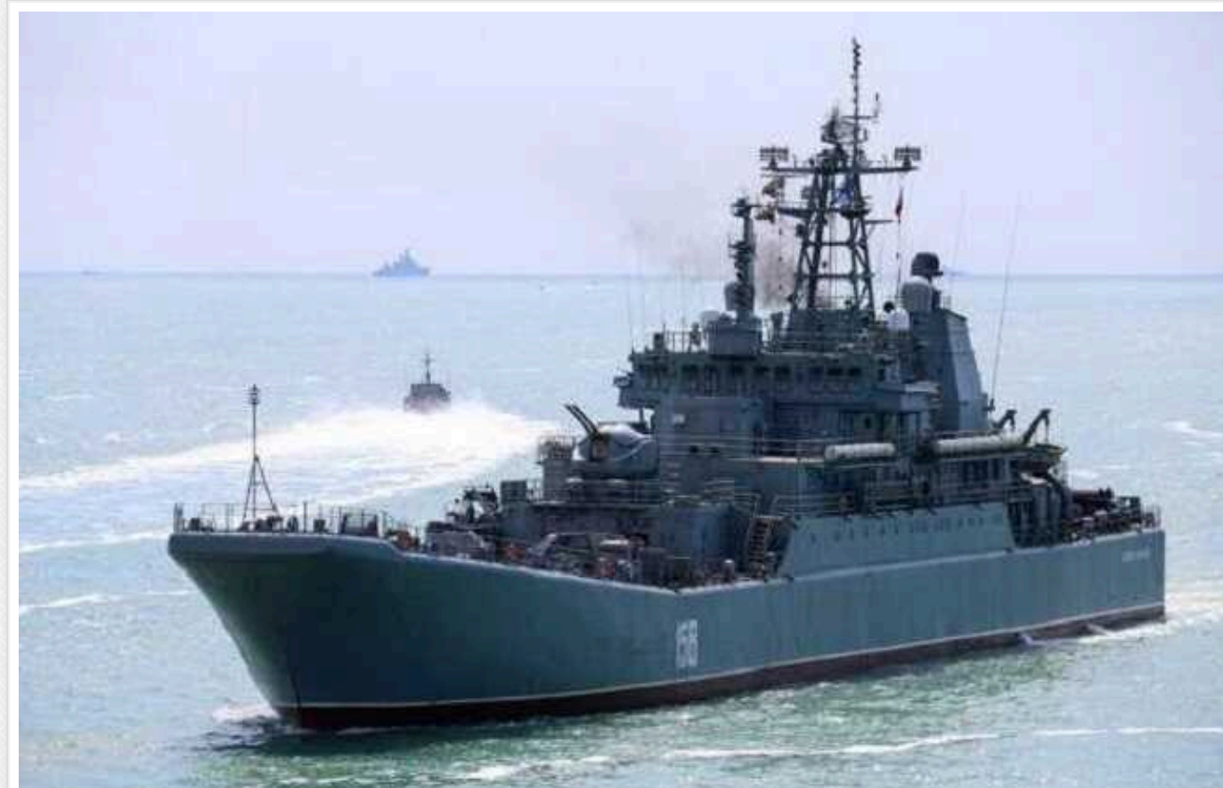
У Британії високо оцінили знищення "Цезаря Кунікова": "Потужне нагадування"

Міністр оборони Великої Британії Грант Шалпс високо оцінив знищення російського корабля "Цезар Куніков" проекту 775. Потоплення великого десантного корабля ЧФ Росії є "потужним нагадуванням" про те, що Україна може виграти цю війну.