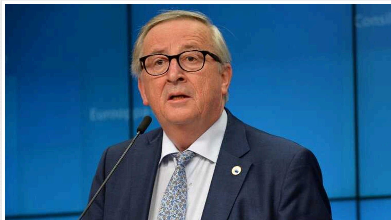
Україна навряд чи вступить до ЄС у найближчі п'ять років, – Жан-Клод Юнкер

Ексглава Єврокомісії Жан-Клод Юнкер в інтерв'ю Neue Zürcher Zeitung заявив, що Україна навряд чи вступить до ЄС у найближчі п'ять років.