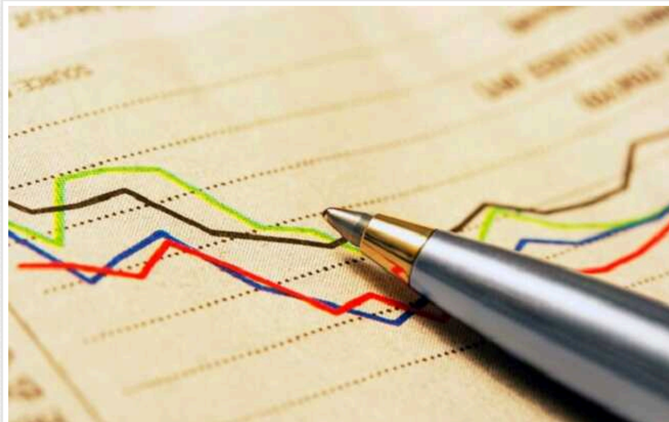
Україна втратить трильйон доларів за два роки: аналітики опублікували прогноз щодо стану економіки країни

Кільський університет економічних досліджень опублікував прогноз, згідно з яким у 2026 році Україна втратить близько 120 млрд доларів в економічному виробництві (ВВП) та майже трильйон доларів основного капіталу. Показники були отримані шляхом аналізу досвіду минулих війн.