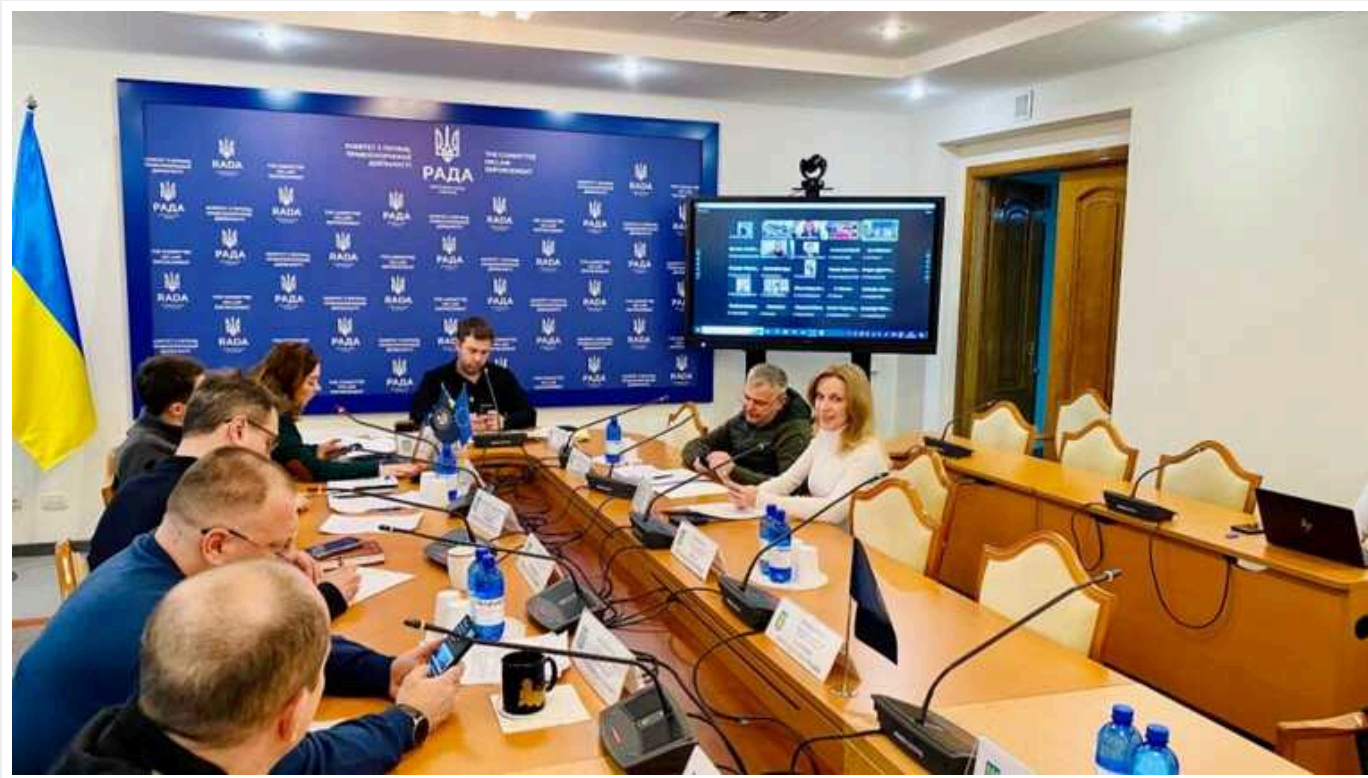
Народна депутатка від «Слуги народу» вважає неконституційним запровадження для депутатів кримінальної відповідальності за прийняття неконституційних законів

Комітет розглянув законопроект, який пропонує ввести кримінальну відповідальність для народних обранців за реєстрацію і прийняття неконституційних законопроектів.