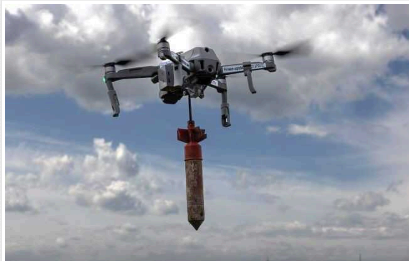
«Пташки» 63-ї ОМБр «відмінували» одразу 7 ворожих мінометів

Українські військові продовжують завдавати нищівних ударів по техніці та особовому складу російських окупаційних військ. Цього разу дрони 63 окремої механізованої бригади ЗСУ вполювали одразу 7 ворожих мінометів.