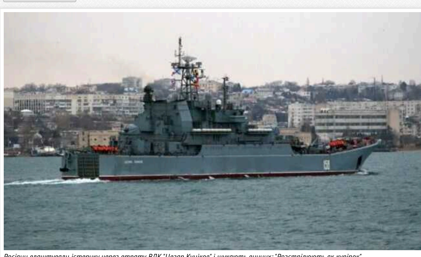
Росіяни влаштували істеріку через втрату ВДК "Цезар Куников" і шукають винних: "Розстрілюють як куріпок"

Російські пропагандисти влаштували істеріку в Мережі через знищення українськими силами великого десантного корабля "Цезар Куников". Вони заявили про профнепридатність командування Чорноморського флоту РФ і констатували, що їхні судна "розстрілюють як куріпок".