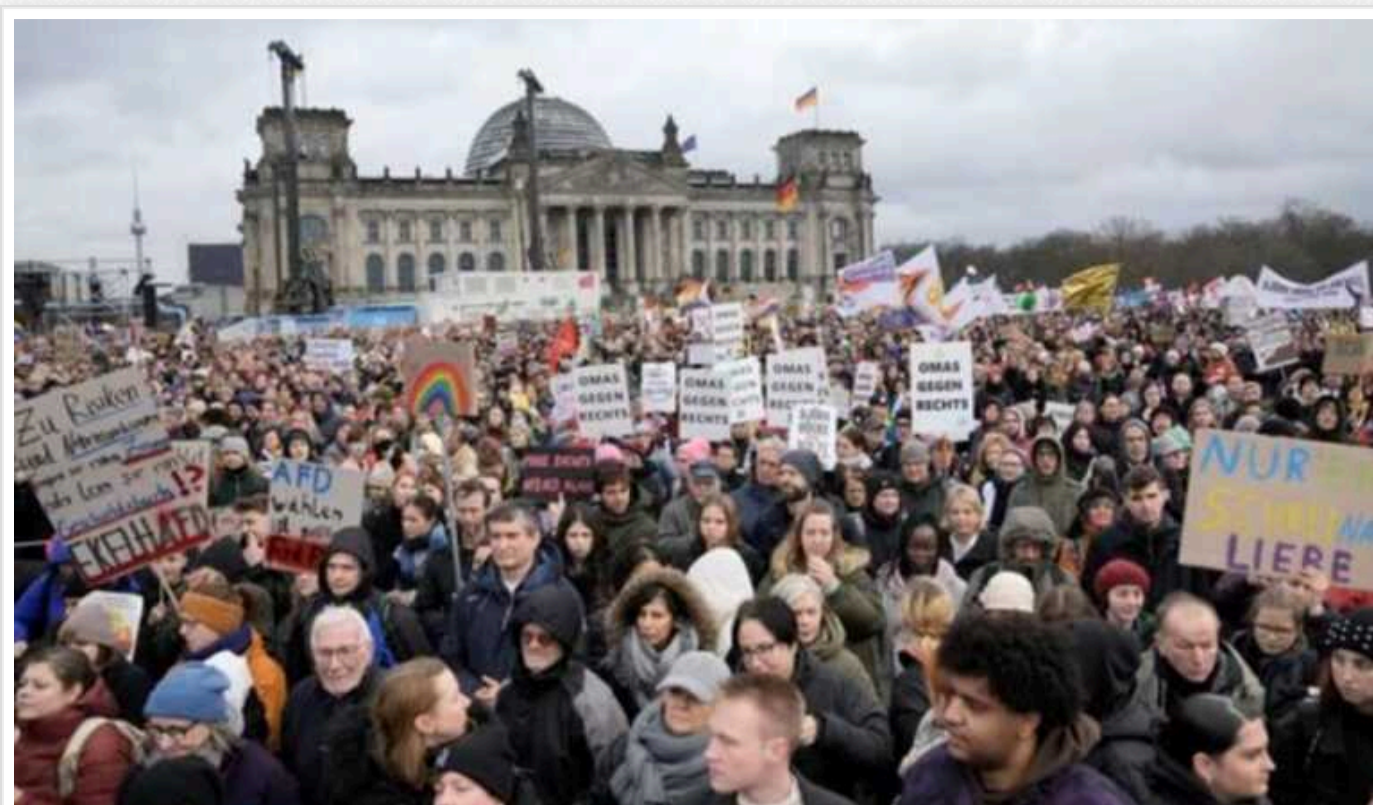
Як РФ просуває свою дезінформацію в Україні та Європі: через соціальні мережі і лобістів

Понад 350 російських лобістів у Німеччині, Франції, Італії виявили дослідники Інституту інноваційного врядування (ІІГ). Ці агенти впливу Росії активно працюють у цих європейських країнах, але з повномасштабним нападом на територію України Росія змінила свій підхід і засоби впливу на людей, які в Європейському Союзі ухваляють важливі рішення на підтримку України.