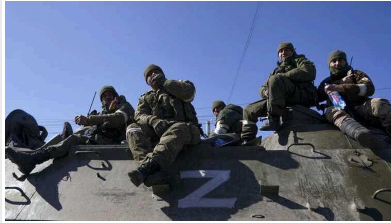
Окупанти намагаються прорвати оборону ЗСУ за "радянською теорією", – ISW

Російські війська в Україні намагаються прорвати оборону Збройних сил за допомогою радянської теорії глибокого бою. Ця теорія, розроблена сто років тому, наражається на поточні можливості України, однак її ключові принципи ще діють в умовах сучасної війни.