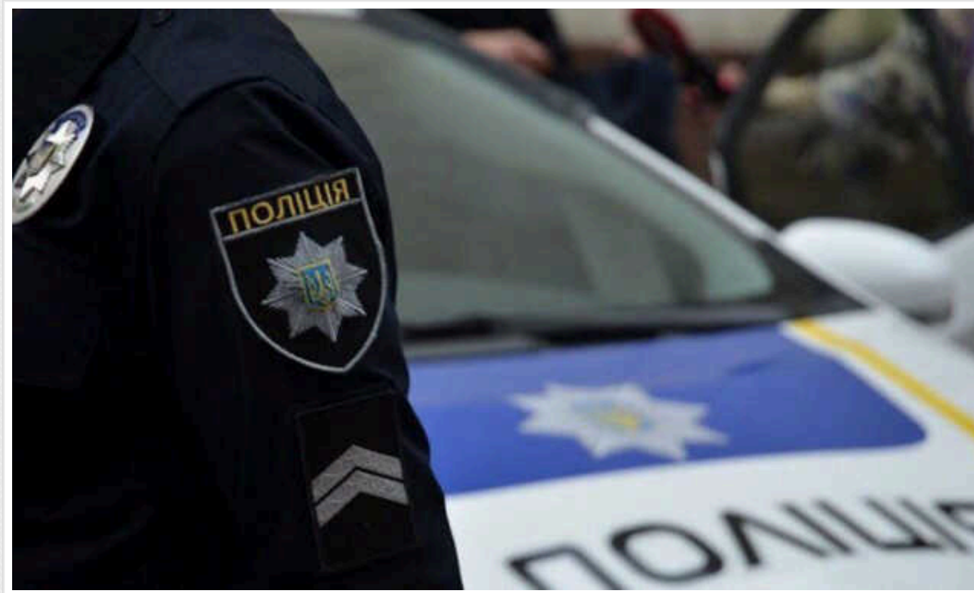
У Києві оперативно затримали трьох зловмисників, які побили та пограбували перехожого

У Києві затримали трьох чоловіків, які у Дніпровському районі побили перехожого до непритомності та пограбували його. Щоб знайти нападників, правоохоронцям знадобилось менше доби.