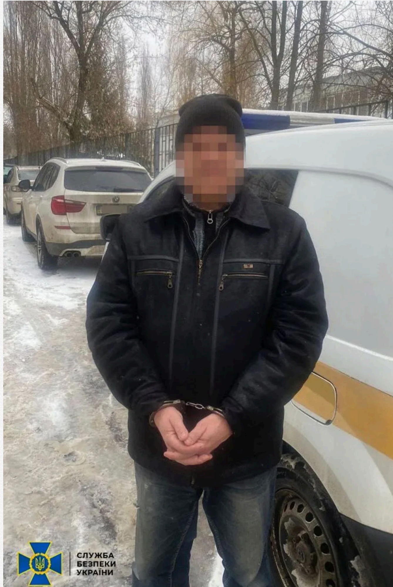
Крім того, поліпчик ворога їздив на місця ворожих прильотів, робив там приховану фото- і відеозйомку, після чого теж передавав це все росіянам. Також чоловік дискредитував у соцмережах українську армію.

За наявності таких відомостей терористи могли «обійти» українську ППО та завдати прицільного удару.