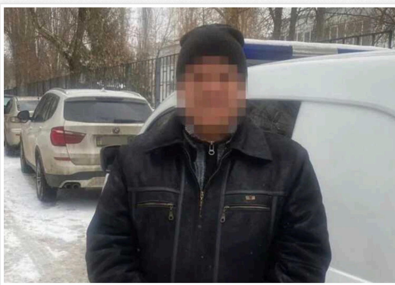
СБУ затримала російського інформатора, який наводив ракети на критичну інфраструктуру Харкова і намагався дискредитувати ЗСУ

Співробітники СБУ затримали в Харкові чергового російського інформатора, який наводив на місто ракети. Ним виявився 58-річний місцевий житель, ідеологічний прихильник російської диктатури, який з власної ініціативи восени 2023 року почав «зливати» окупантам розвідувальну інформацію через месенджери.