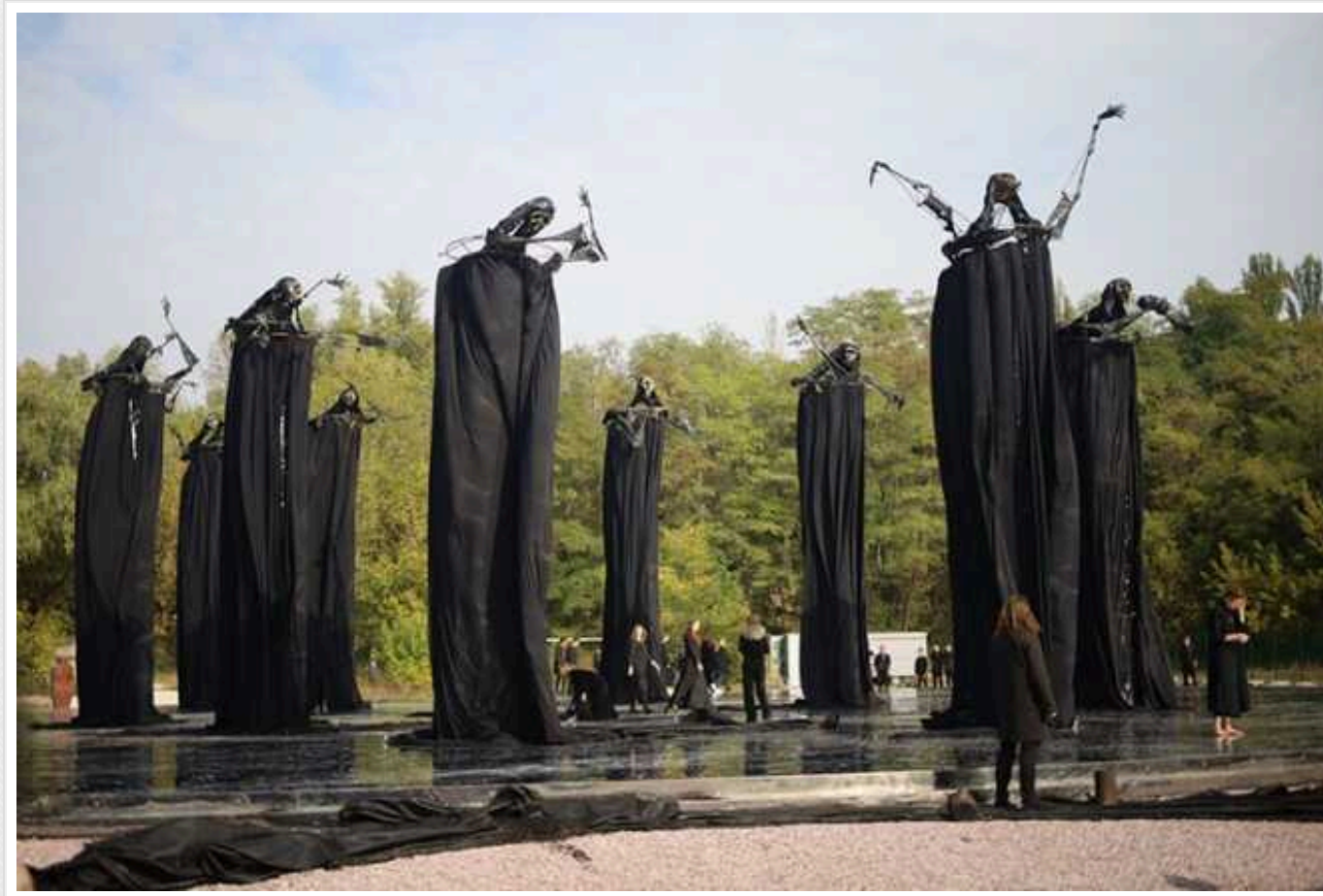
Мешканцю Києва повідомили про підозру за антисемітські стріми у соцмережах та виправдання агресії РФ, - прокуратура

Зокрема антисемітські висловлювання він робив у парку-меморіалі Бабин Яр.