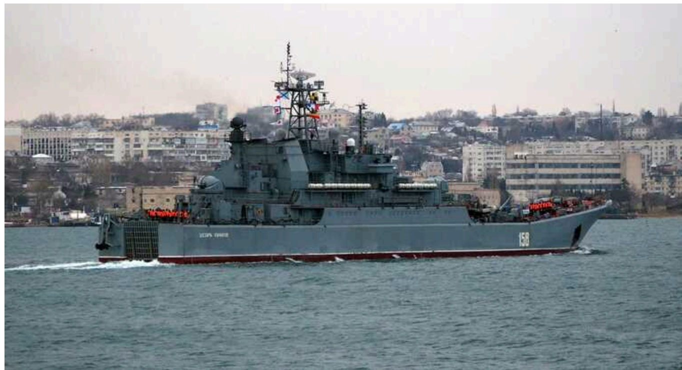
У Чорному морі після знищення "Цезаря Кунікова" у РФ залишається ще п'ять великих десантних кораблів, - ВМС

На початку повномасштабного вторгнення Росія тримала у Чорному морі 13 великих десантних кораблів, зараз їх залишилося п'ять.