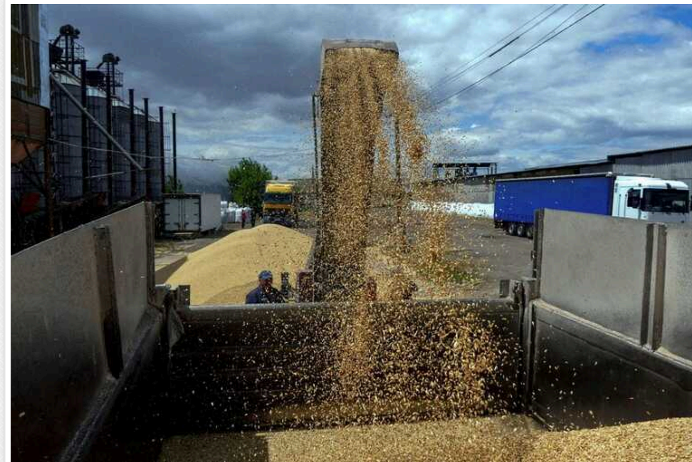
Україна не заперечує проти додаткових перевірок зерна у Польщі, - Мінагрополітики

Україна готова до додаткових перевірок зерна у Польщі, що йде через територію країни транзитом.