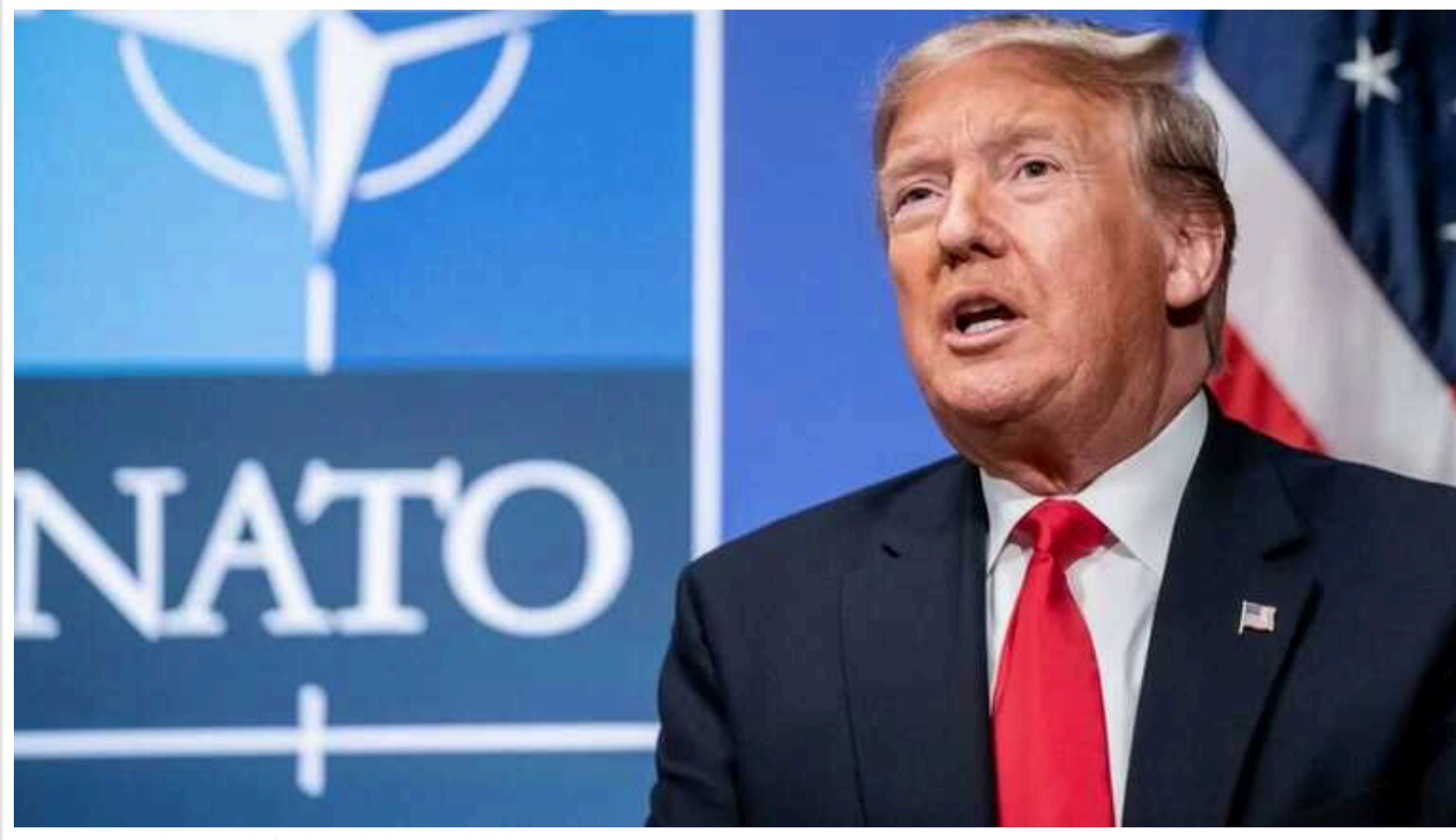
Трамп розглядав вихід США з НАТО ще у 2018 році, - Politico

Трамп був близьким до виходу США з НАТО ще у 2018 році на саміті у Брюсселі.