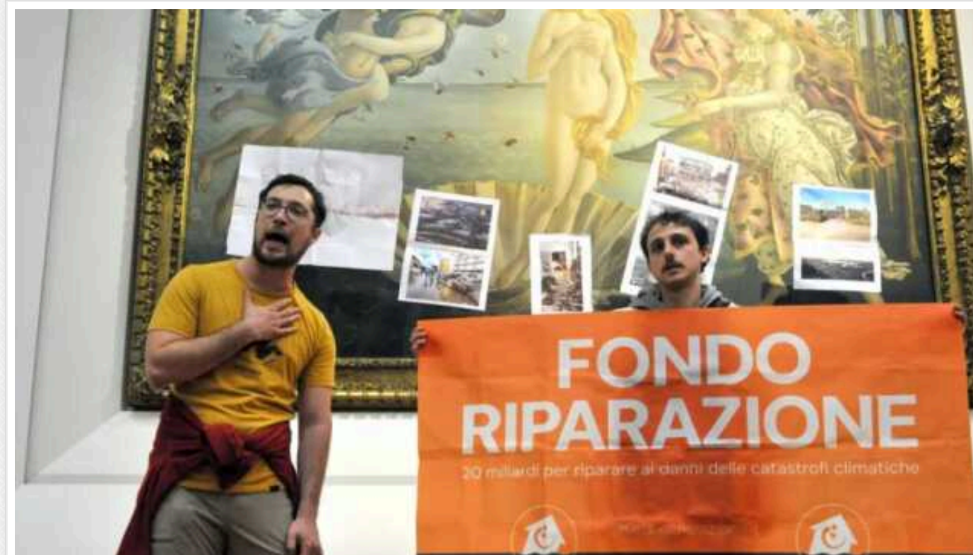
У Флоренції екоактивісти приклеїли наліпки на картину Боттічеллі

У Флоренції екоактивісти у вівторок приклеїли фотографії руйнівних змін клімату до скляної панелі на знаменитій картині Сандро Боттічеллі «Народження Венери».