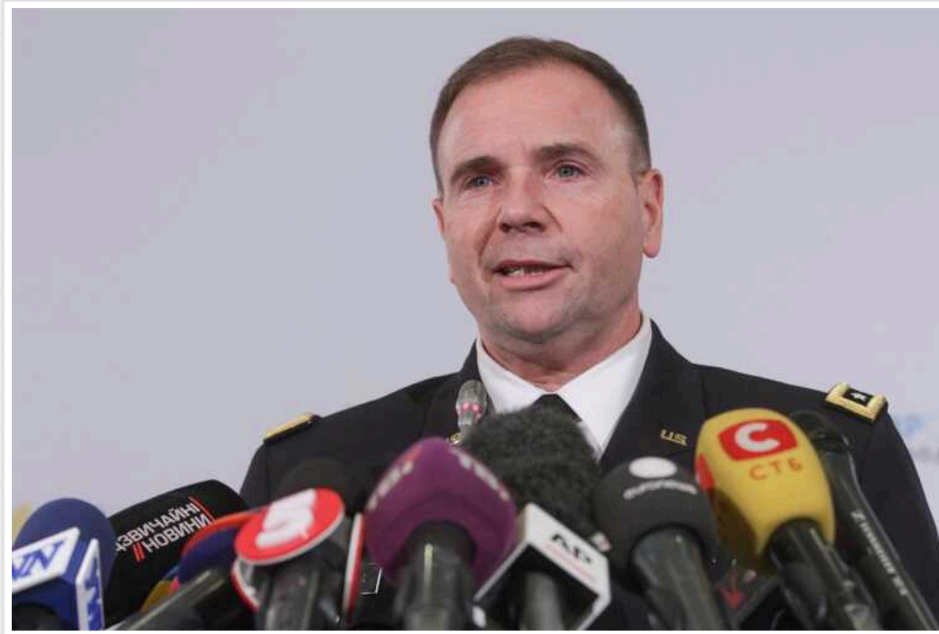
Трамп ненавидить альянси, його не хвилюють моральні зобов'язання, - генерал Ходжес

Екскомандувач силами США в Європі генерал (у відставці) Бен Ходжес різко прокоментував слова Дональда Трампа про НАТО.