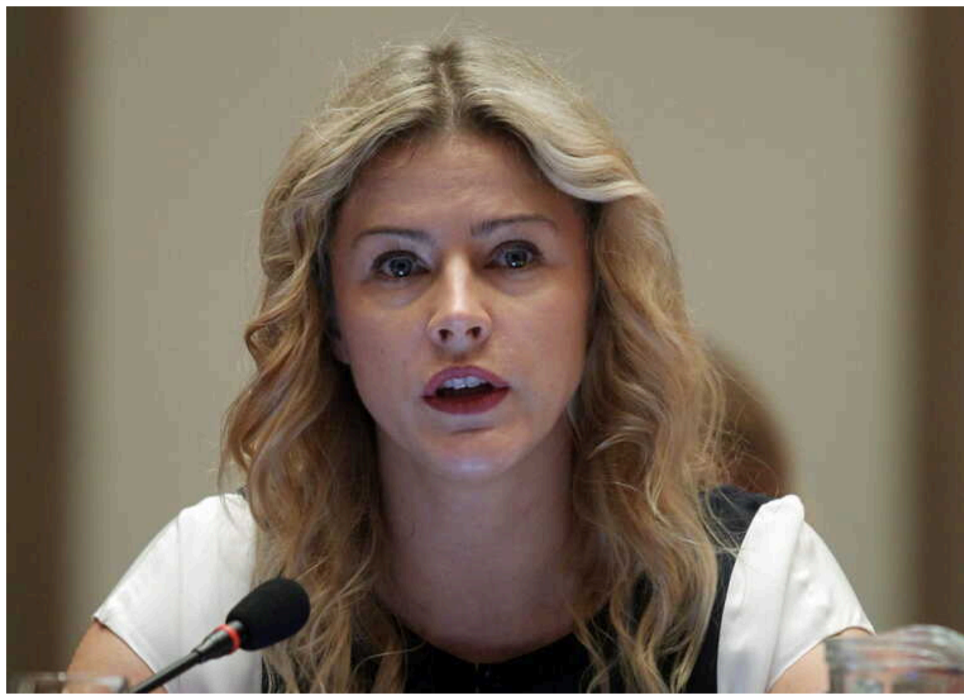
Латвія не піддається на залякування РФ, - прем'єр Сіліня

Прем'єрка Латвії Євіка Сіліня прокоментувала оголошення Росією в розшук низки політиків з країн Балтії.