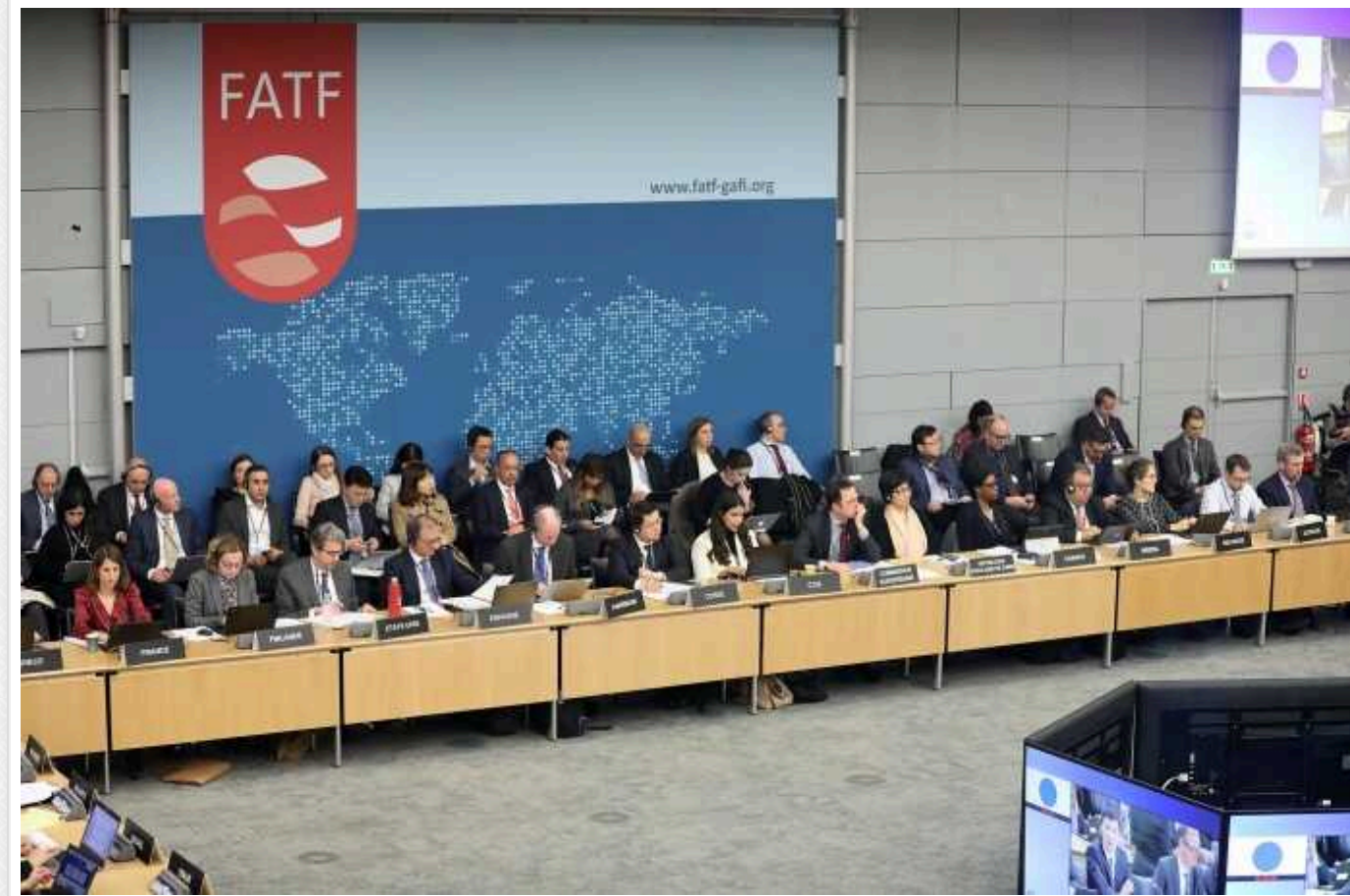
Україна знову закликала FATF внести Росію до "чорного списку" на тлі посилення зв'язків з Іраном та КНДР

Міністерство фінансів України та Держслужба фінансового моніторингу України знову закликали Групу з розробки фінансових заходів боротьби з відмиванням грошей (FATF) внести Росію до чорного списку на тлі посилення зв'язків з Північною Кореєю та Іраном.