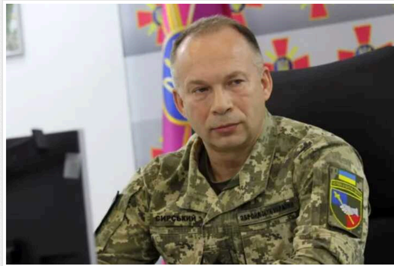
Головом ЗСУ Сирський після візиту на фронт виступив із заявою і назвав головні виклики для армії

Головнокомандувач Збройних сил України Олександр Сирський та міністр оборони Руслан Умеров здійснили робочу поїздку до військових частин і підрозділів, які тримають оборону на Авдіївському та Куп'янському напрямках. За її результатами було ухвалено низку рішень, спрямованих на посилення бойових спроможностей захисників.