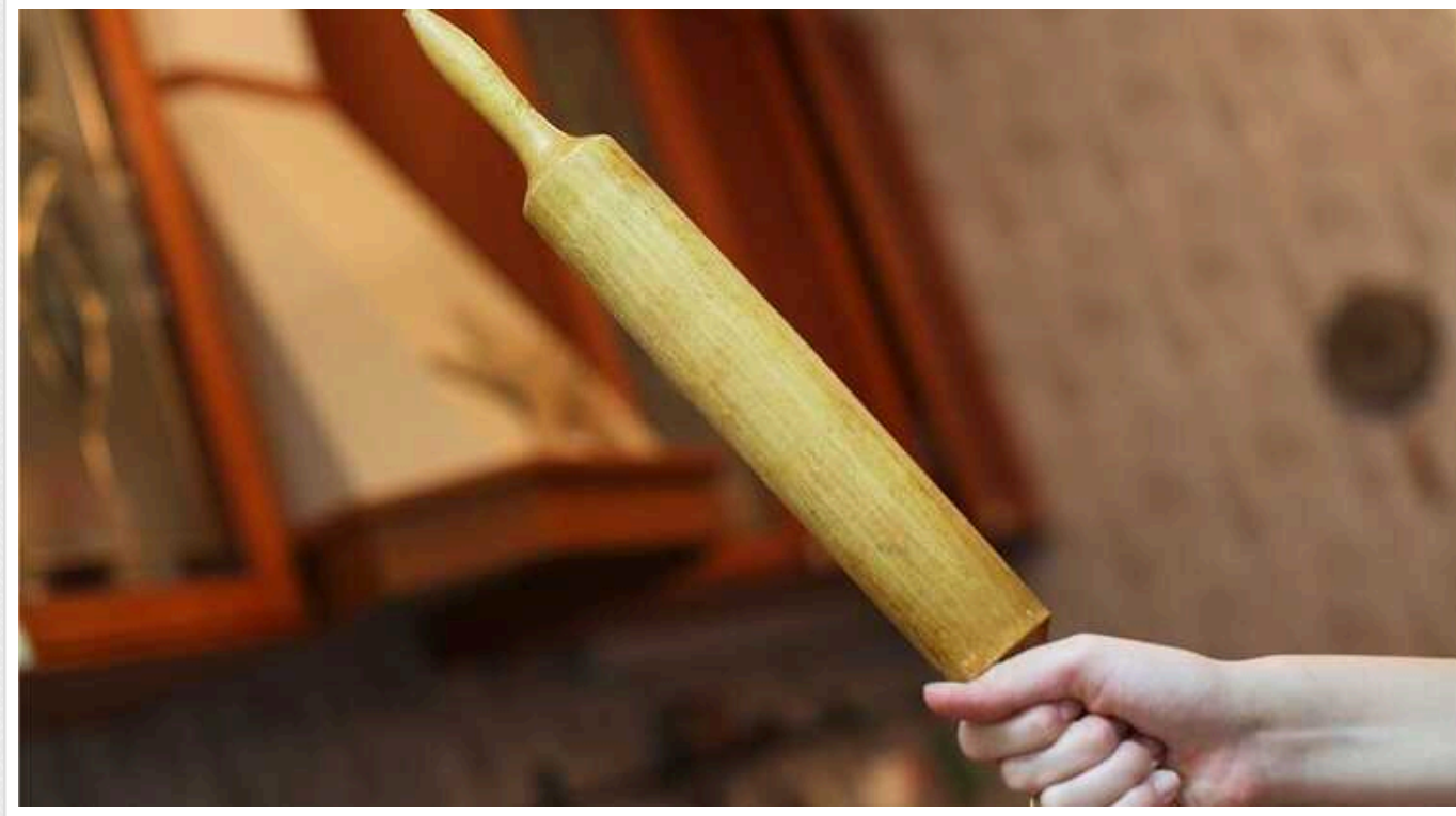
Суд оштрафував мешканку Хмельниччини за побиття чоловіка качалкою

Теофіпольський районний суд Хмельницької області виніс вирок жінці, яка завдала умисне легке тілесне uszkodження своєму чоловіку. Вона має заплатити штраф у розмірі 850 грн.