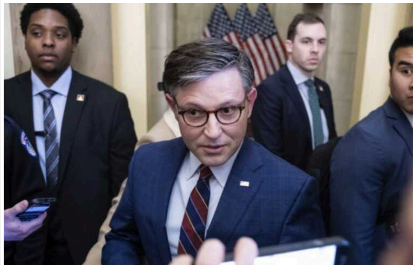
Спікер Палати представників Джонсон повідомив, що не має наміру виносити на розгляд палати пакет допомоги Україні та Ізраїлю від Сенату

"Безперечно, не планую", - сказав Джонсон, коли його запитали, чи планує він вивести на розгляд Палати законопроект.