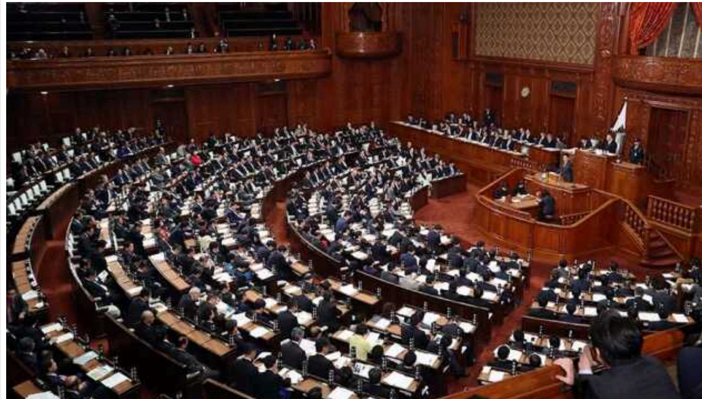
Понад 80 депутатів Японії від правлячої партії замішані у фінансовому скандалі

У ході внутрішньопартійної перевірки у правлячій ув Японії Ліберально-демократичній партії (ЛДП) встановлено, що 82 члени парламенту від ЛДП із 374-х не зареєстрували доходи від збору коштів у звітах про політичні фонди або навмисно занизили їх.