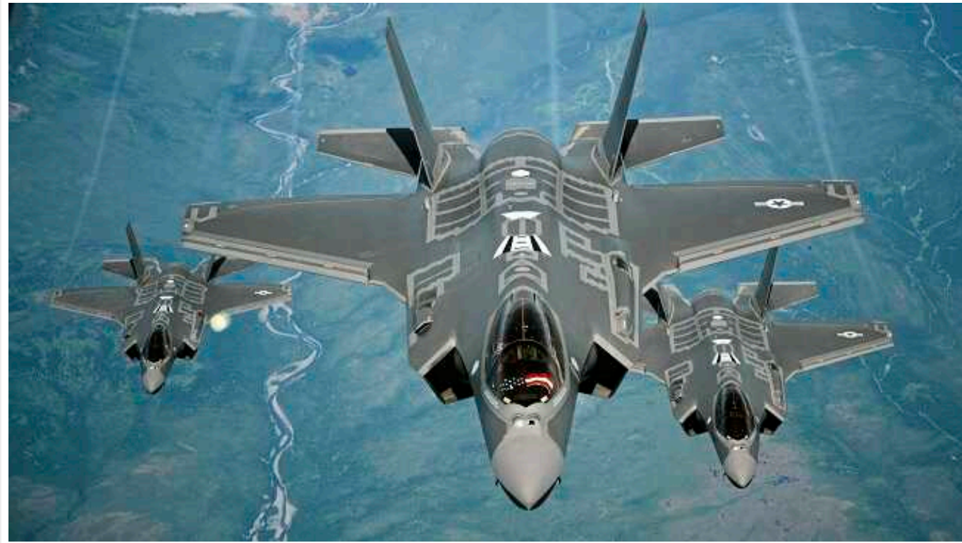
У Нідерландах планують оскаржити рішення суду про заборону постачання Ізраїлю запчастин для F-35

Уряд Нідерландів подасть касаційну скаргу до Верховного суду, щоб оскаржити рішення апеляційного суду щодо припинення поставок Ізраїлю запчастин для винищувачів F-35.