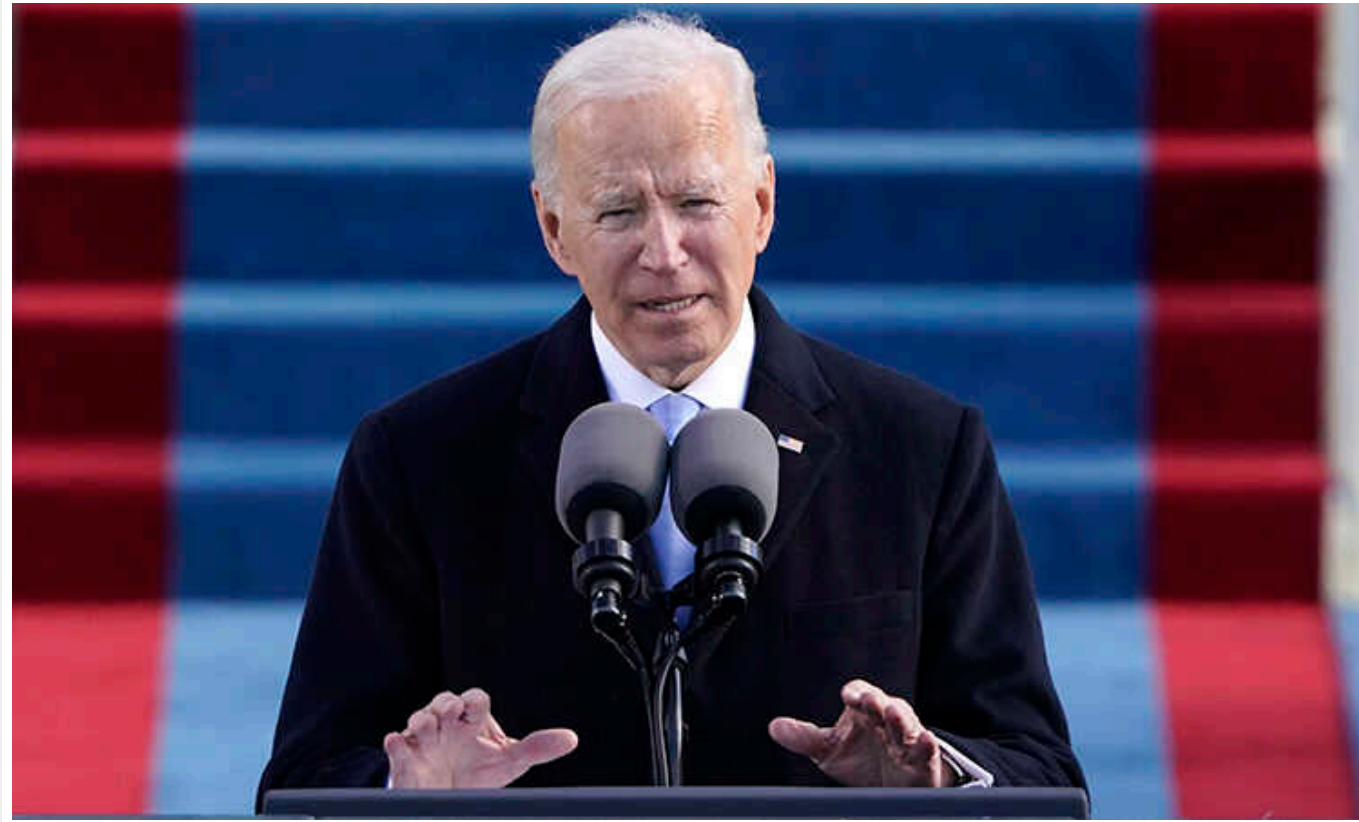
Президент США назвав звільнення міністра внутрішньої безпеки неконституційним

Президент США Джо Байден розкритикував дії республіканців та назвав неконституційним звільнення міністра внутрішньої безпеки США Александро Майоркаса.