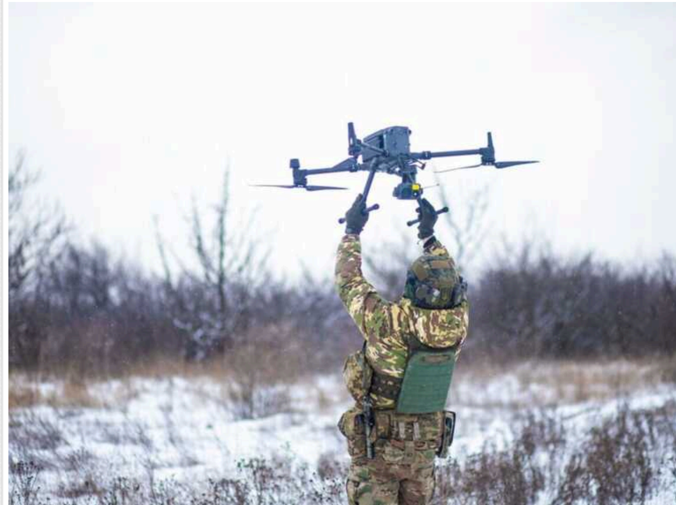
Порівняно з планами виробництва України, план РФ – 32 000 БПЛА на рік здається скромним, - ЗМІ