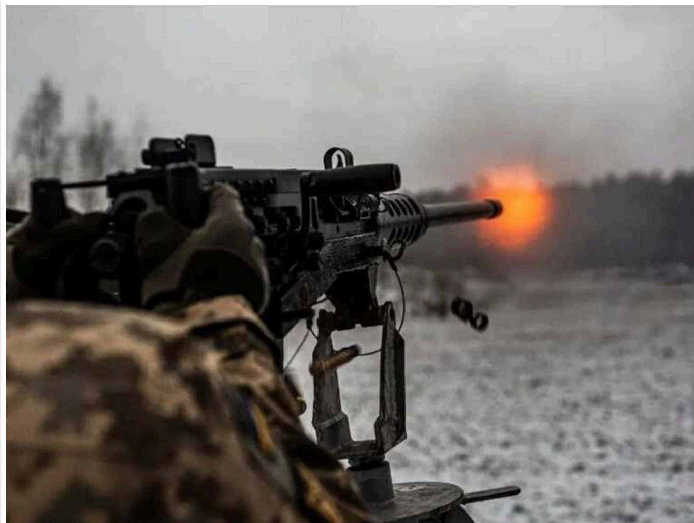
На Запорізькому напрямку штурмовики взяли в полон 11 окупантів і показали відео

Сили оборони України на Запорізькому напрямку відбили атаку окупантів та змогли взяти в полон 11 росіян.