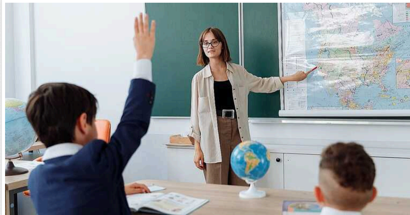
В Україні пропонують позбавляти педагогічного звання за булінг, мобінг і колабораціонізм

Освітній омбудсмен Сергій Горбачов пропонує знижувати кваліфікаційну категорію та позбавляти педагогічного звання педагогів у разі притягнення до відповідальності за булінг, мобінг та колабораційну діяльність.