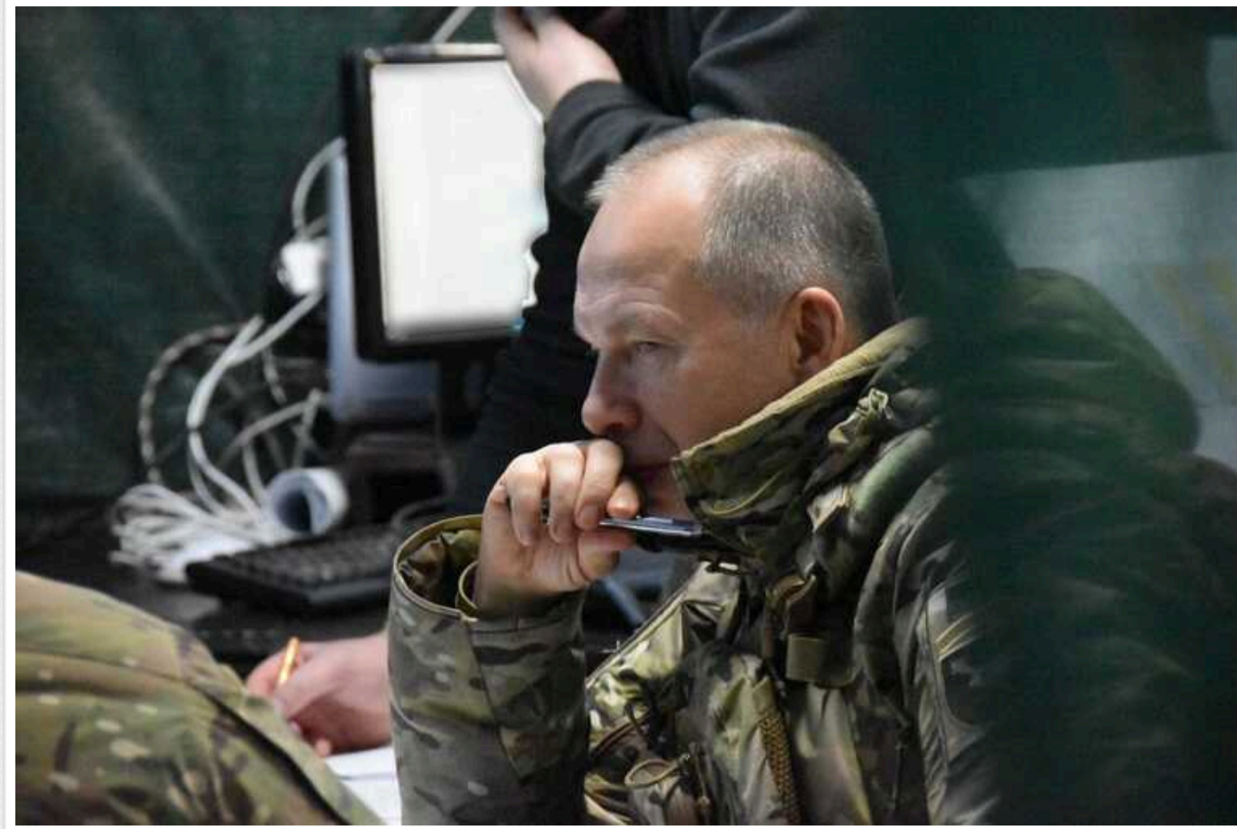
Сирський окреслив головну мету ЗСУ: "Треба напружитися всім"

За словами Олександра Сирського, ЗСУ перейшли від наступальних дій до ведення оборонної операції, тому українським бійцям необхідно виснажити противника, завдати йому максимальних втрат.