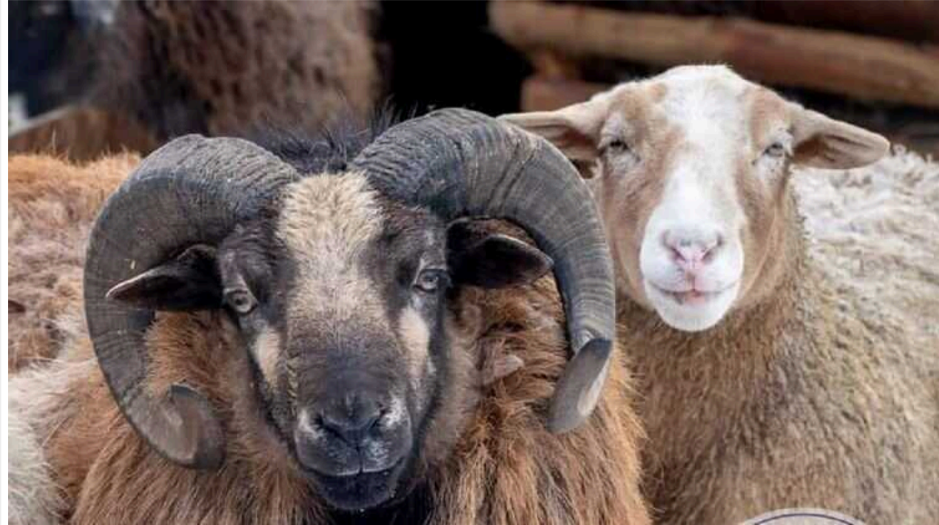
Вівця та баран стали найромантичнішою парою на День закоханих в Одесі

Одеський зоопарк до Дня святого Валентина влаштував голосування "Пара року-2024". Учасники мали вибрати найромантичнішу парочку серед тварин.