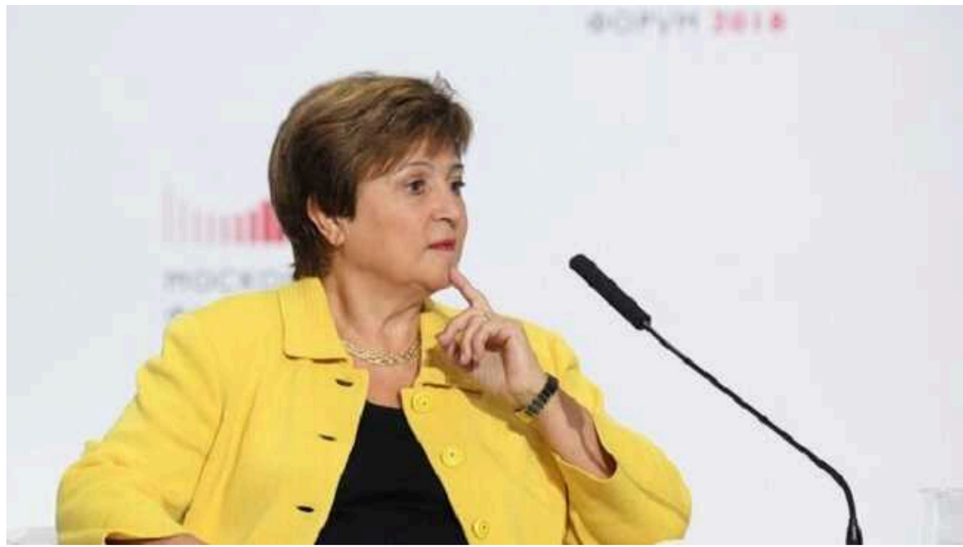
Директор-розпорядник Міжнародного валютного фонду. Україна потребує цього року 42 мільярди доларів зовнішнього фінансування

Директор-розпорядник Міжнародного валютного фонду Крісталіна Георгієва в інтерв'ю CNBC повідомила, що Україна потребує цього року 42 млрд доларів зовнішнього фінансування.