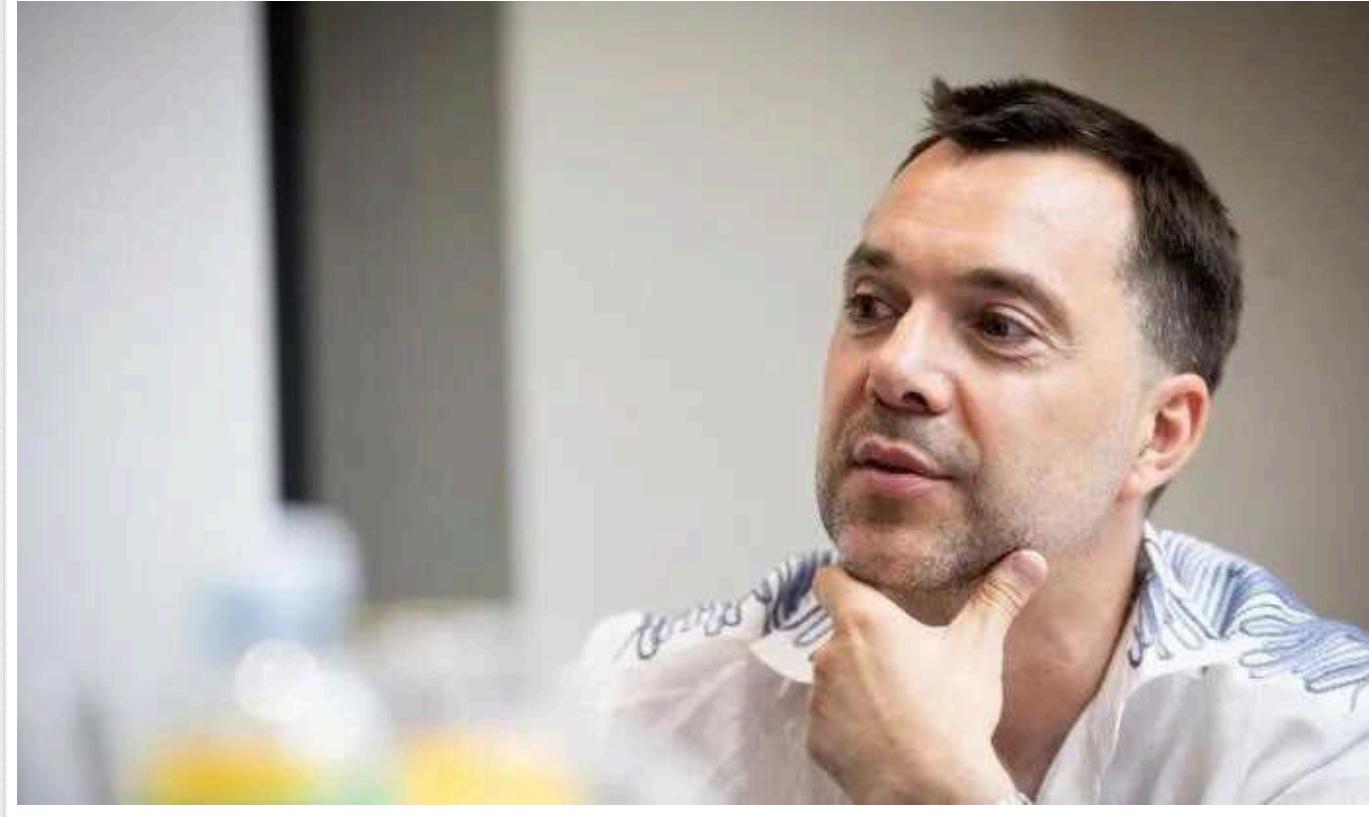
Путін не хоче воювати з Україною та готовий припинити війну, - Арестович

Олексій Арестович, коментуючи недавнє інтерв'ю російського президента, заявив, що Путін не хоче воювати з Україною та готовий припинити війну.