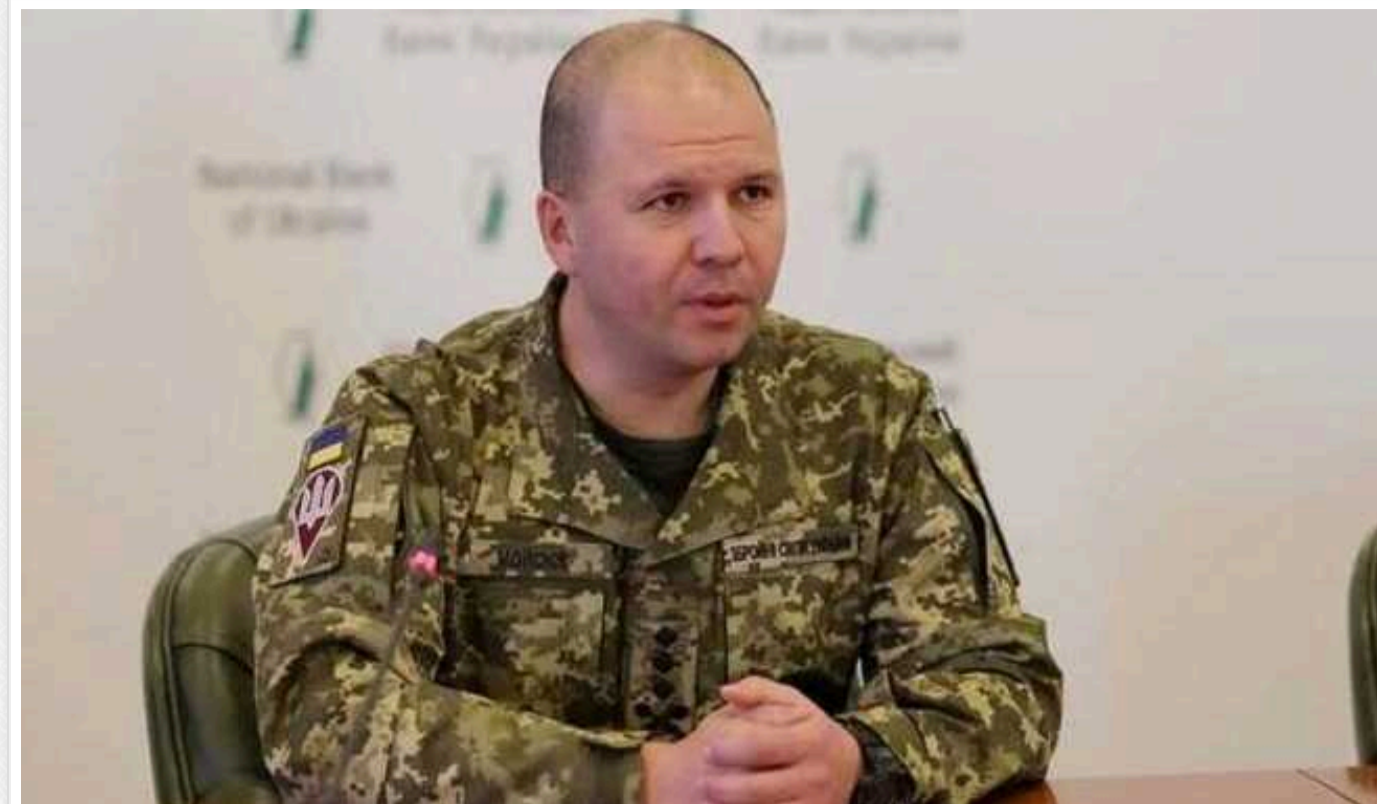
Зеленський призначив генерала Мойсюка своїм уповноваженим із безпекових гарантій

Президент України Володимир Зеленський ввів посаду спеціального уповноваженого з питань реалізації міжнародних безпекових гарантій та розвитку сил оборони України в структуру Офісу президента та призначив на цю посаду Євгена Мойсюка.